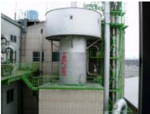
巨大な粉石けん用スプレータワー