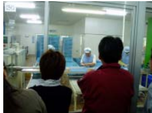
固形石けん選別作業のようす