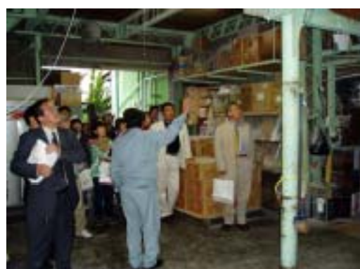
粉石けん製造の見学のようす