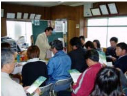
まるは油脂化学の概要説明