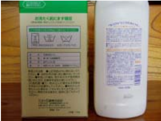
商品の裏にある表示

けん商品のみという自然食品店や、組合員制の販売店（グリーンコープ等）もあります。商品には、ベビー用の肌に優しい商品や贈答品店には「せっけんのギフトセット」もありますので、ぜひ探してみてください。