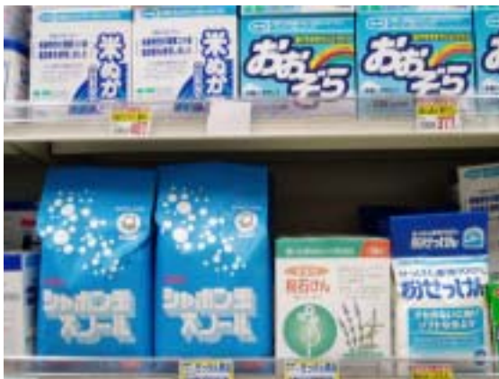
市民生協のせっけんコーナー (洗濯用せっけん商品)