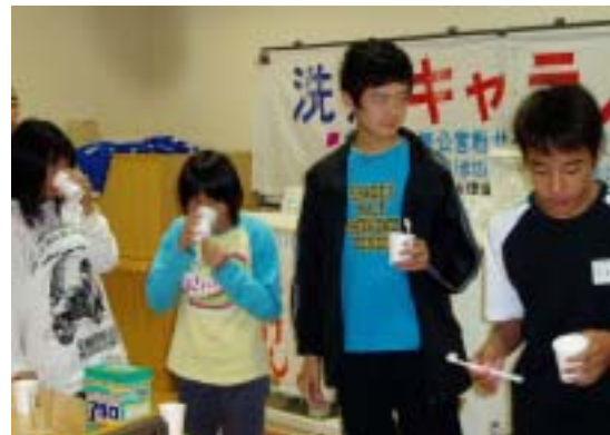
歯磨きテストのようす (洗濯キャラバン)

子ども用の歯磨き剤には、イチゴ味やバナナ味といった子どもが喜びそうな商品がありますが、保育園・幼稚園・小学校などでは昼食の後に歯磨きをしているので、今後教育の場でも、この事についても働きかけをしていきたいと考えています。