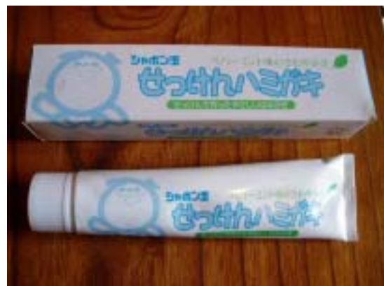
せっけんはみがき (シャボン玉石けん)