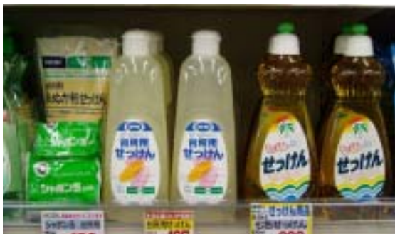
市民生協のせっけんコーナー (台所用せっけん商品)

ここ数年の洗濯キャラバンでは「歯磨きテスト」という実験をしています。歯磨き剤は直接口から入るものなので、合成洗剤（に分類されるもの）の歯磨き剤に含まれる発泡剤などの成分が、口の中の味蕾（みらい）を破壊し味を変えてしまう実験を体験させています。